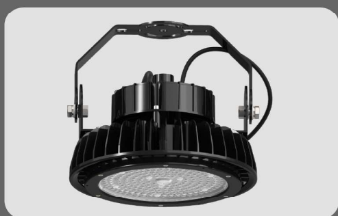
Montaż oprawy do stałego podłoża.