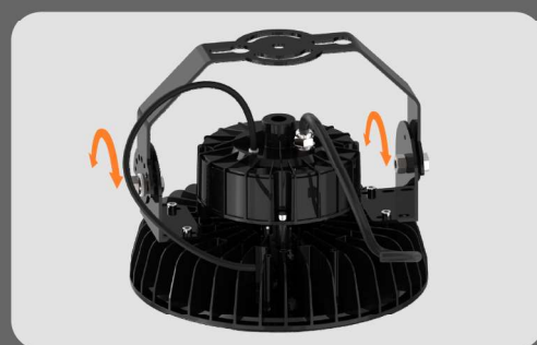
Regulacja w zakresie -75^{\circ} \div +75^{\circ}

Uchwyt umożliwiający instalację oprawy ROCO na ścianie lub suficie. Konstrukcja uchwyty pozwala precyzyjnie skierować strumień światła dla osiągnięcia najlepszego efektu.